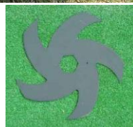
V S 刃